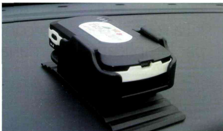
L'EcoGyzer de Nomadic Solutions, qui se pose sur le tableau de bord sans être branché au système électronique du véhicule, a été choisi par Mobigreen pour enregistrer les données de conduite des stagiaires.

Aujourd'hui, les clients de Mobigreen cherchent davantage à construire une stratégie globale autour de l'éco-conduite. La filiale de La Poste ne se contente pas de former les collaborateurs de l'entreprise, mais analyse la flotte et élabore un plan d'action qui